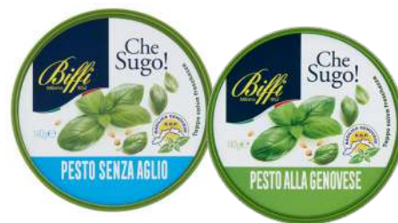
PESTO FRESCO BIFFI - GR140