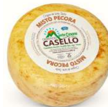
MISTO PECORA CASELLO