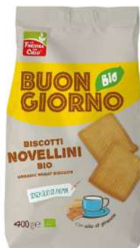
NOVELLINI BUONGIORNO BIO GR.500