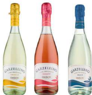
GARZELLINO BIANCO/ROSATO CL75