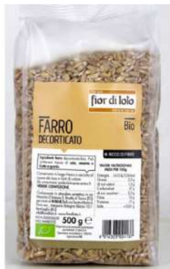
FARRO DECORTICATO FIORDILOTO GR. 500