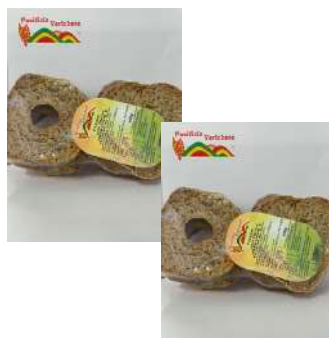
FRISA VERICHESE GR 400