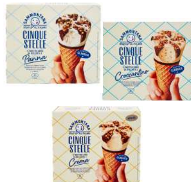
CONO 5 STELLE GR450